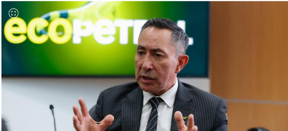
Ricardo Roa presidente de Ecopetrol.

La Fiscalía procesa al presidente de Ecopetrol por supuesto tráfico de influencias.