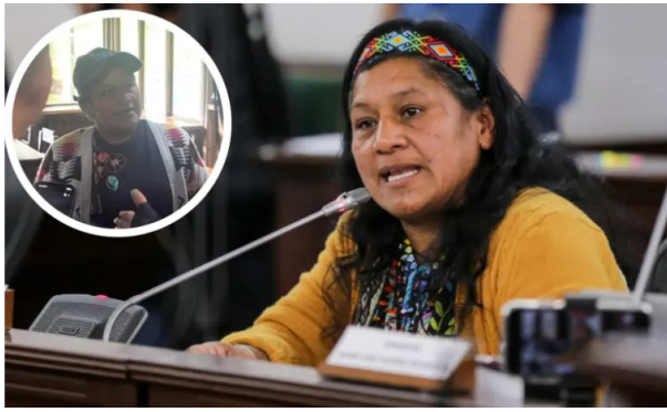
Quilcué lideró el Consejo Regional Indígena del Cauca (CRIC) y fue ganadora del Premio Nacional de Derechos Humanos en Colombia de 2021. Fue hallada con vida.