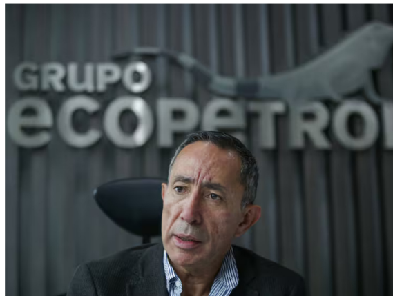
Presidente de Ecopetrol, Ricardo Roa Barragán.

Entre el 11 y el 12 de marzo, el presidente de Ecopetrol será imputado en medio de las investigaciones que adelanta en su contra la Fiscalía.