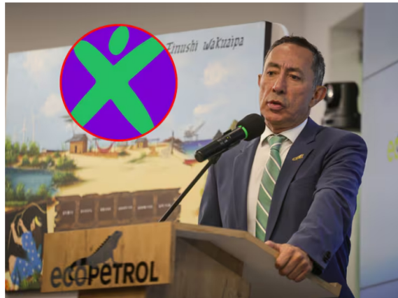
Ricardo Roa y Verde Oxígeno.

La colectividad advirtió que la imputación de cargos contra el presidente de la compañía "impacta de manera negativa en el índice reputacional"