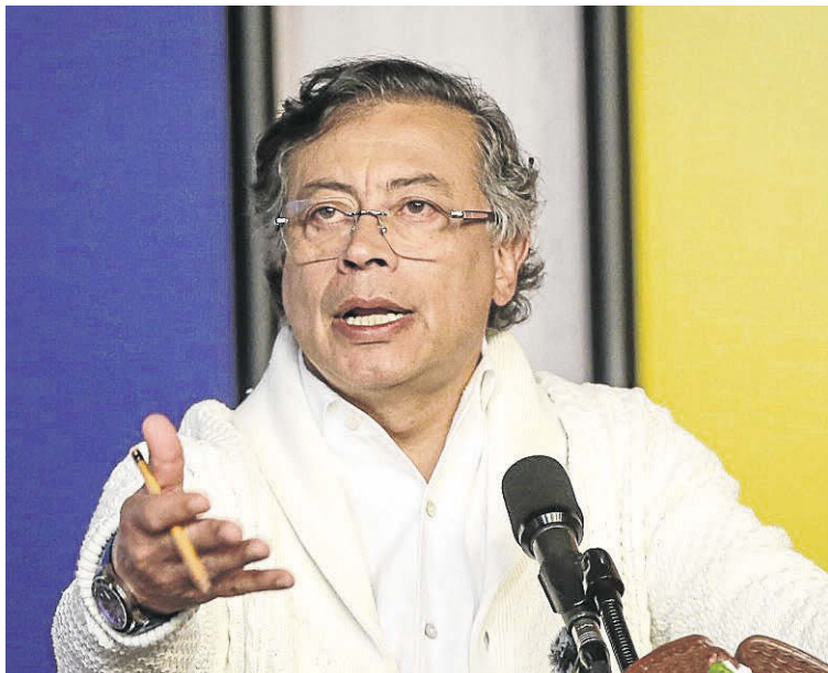
Gustavo Petro, presidente de Colombia, impulsa un nuevo decreto de Emergencia Económica, Ambiental y Social.

El presidente insiste en que la emergencia se debe declarar en todo el país, a causa de las fuertes lluvias sin precedentes en el Caribe y otras regiones que, además, se trata de un evento imprevisible asociado a la crisis climática.