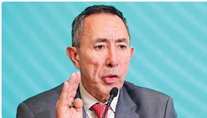
El presidente de Ecopetrol, Ricardo Roa.

Al contrario, quien saldría mal librado en esta ocasión sería el presidente de Ecopetrol , Ricardo Roa.