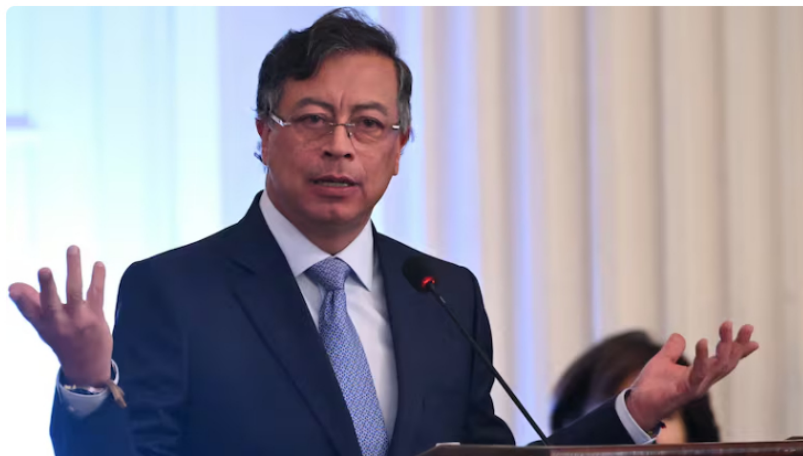
El principal argumento jurídico sería la "ausencia de dolo", es decir, que, según los investigadores, el entonces candidato del Pacto Histórico desconocía el ingreso y salida de los dineros usados para pavimentar su llegada a la Casa de Nariño.

En términos sencillos, el triunvirato de congresistas salvaría al presidente con la tesis de que todo fue a sus espaldas.