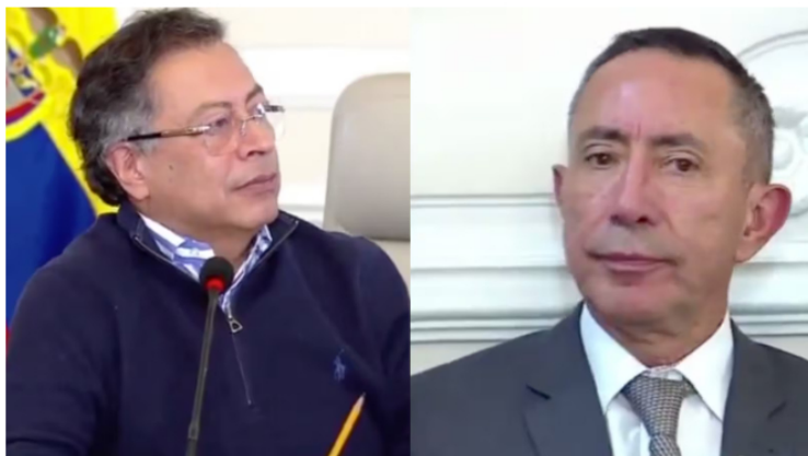
Gustavo Petro y Ricardo Roa durante el consejo de ministros.

La Fiscalía General de la Nación radica imputación contra Ricardo Roa, presidente de Ecopetrol. Conozca los detalles sobre la violación de topes en la campaña Petro y el caso de su lujoso apartamento.