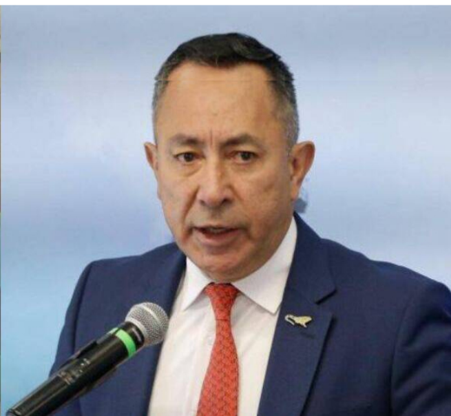
Ricardo Roa, presidente de Ecopetrol . Foto: EL TIEMPO