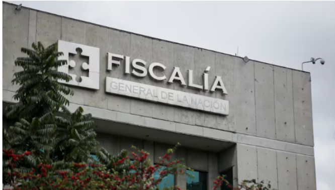
La Fiscalía investiga al presidente de Ecopetrol .

La segunda imputación tiene que ver con la compra de un lujoso apartamento en Bogotá a un precio por debajo del valor comercial, operación en la que habría estado involucrado un empresario que tiene negocios con Ecopetrol .