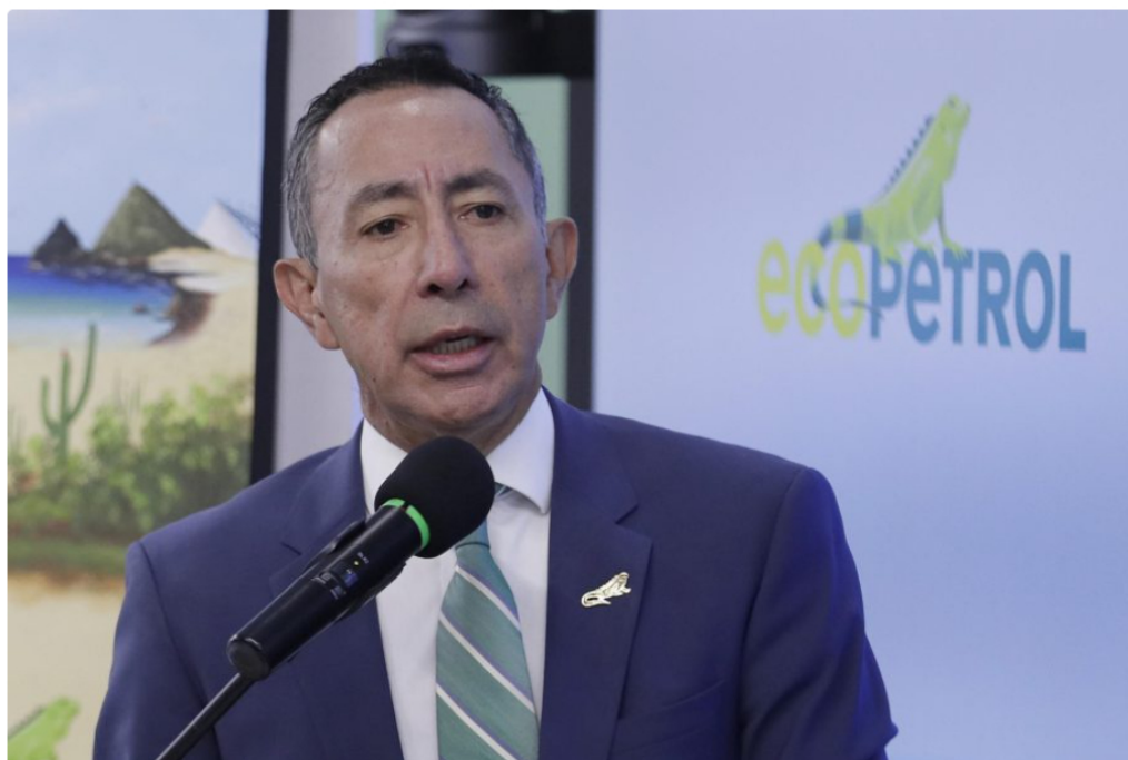
Fotografía de archivo del 7 de julio de 2026 que muestra al presidente de Ecopetrol , Ricardo Roa, en rueda de prensa en Bogotá (Colombia).

La Fiscalía colombiana imputará cargos por violación de los topes de gastos electorales y tráfico de influencias contra Ricardo Roa , quien dirigió la campaña presidencial del hoy mandatario Gustavo Petro y actualmente ocupa la presidencia de la petrolera estatal Ecopetrol .