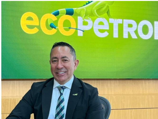
El presidente de Ecopetrol , Ricardo Roa. ECOPETROL