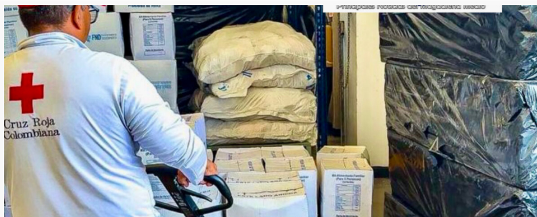
Misión humanitaria de la Gobernación de Bolívar garantiza ayudas a todos los damnificados de Montecristo y Arenal del Sur