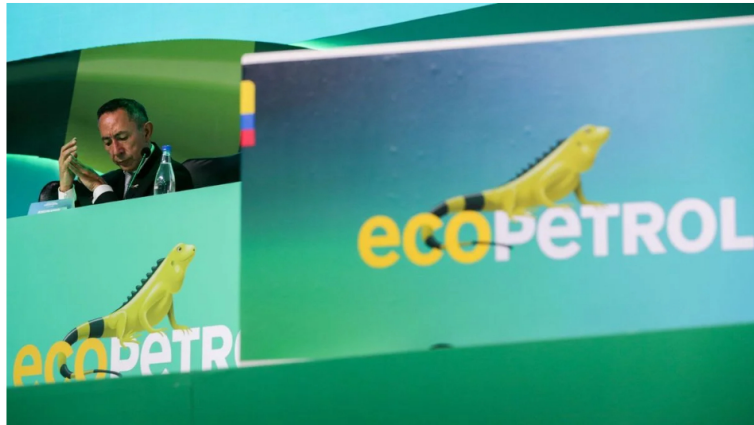
Asamblea General de Accionistas de Ecopetrol.

El Grupo Ecopetrol inició el proceso de comercialización del gas natural que será importado a través de la infraestructura de la Sociedad Portuaria Puerto Bahía, ubicada en Cartagena y de propiedad de Frontera Energy.