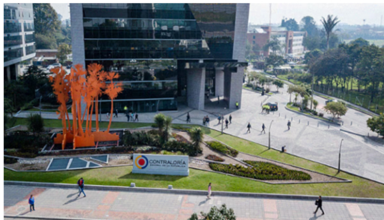
Sede de la Contraloría General de la República de Colombia. GOBIERNO DE COLOMBIA

El contralor delegado de Minas se ve muy estudioso, muy elegante, pero poco dado a hacer lo que se le encargó: cuidar el dinero de los colombianos