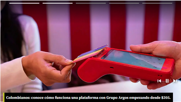
Colombianos: conoce cómo funciona una plataforma con Grupo Argos empezando desde $205.

5,5%, mientras que Bolívar cerró con US$2.368 millones, un aumento de 4,2% y una participación de 4,7%.