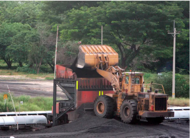
Ecopetrol y Drummond lideraron las exportaciones de Colombia en 2025.

Grandes exportadores impulsaron ventas externas de Colombia en 2025, con liderazgo empresarial y regional, aunque persisten desafíos estructurales nacionales globales.