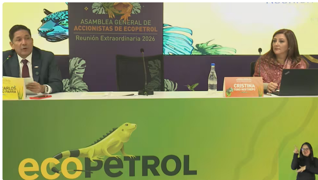
Asamblea extraordinaria de Ecopetrol 2026

Después de sacar adelante la agenda propuesta en la Asamblea extraordinaria de Ecopetrol que se realizó este jueves 5 de febrero en el recinto de Corferías, empezaron las tensiones .