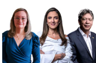
"Controlar márgenes, fórmulas o