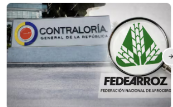
Contraloría terminó auditoría a fondo