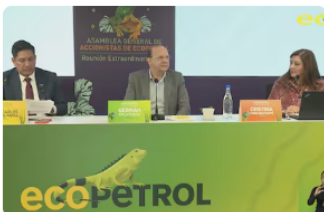
Lo que diga el Gobierno: accionistas de