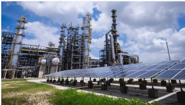
Reficar (Electrolizador de hidrógeno).

Forbes Colombia Staff | febrero 5, 2026 @ 9:44:46 am