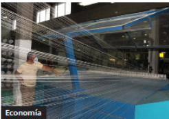
Industria colombiana: Producción cae, ANDI propone recuperación