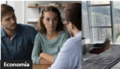
Pareja demanda a lujoso hotel de Río por vista a favela