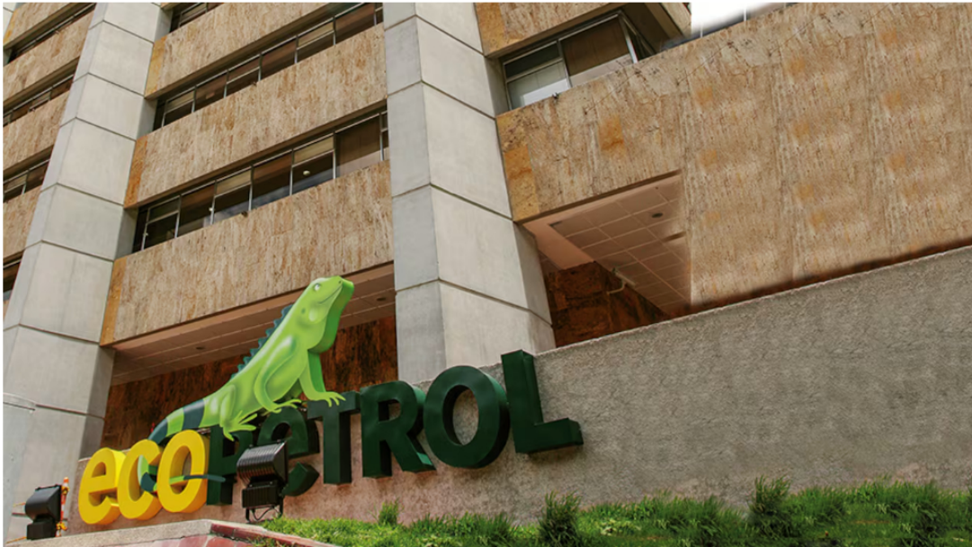
La Asamblea General de Accionistas de Ecopetrol aprobó la plancha presentada por el Ministerio de Hacienda para el periodo 2025-2029.

🌟 Siga a EL PAÍS en Google Discover y no se pierda las últimas noticias