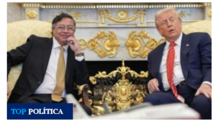
Trump y Petro acuerdan un trabajo conjunto y combate al narcotráfico