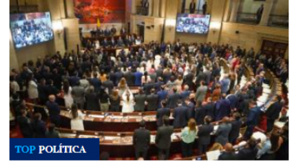
Siete grandes debates de control político que se avecinan en el Congreso