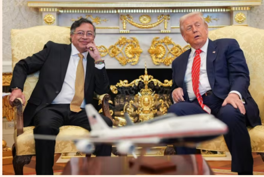
El presidente de Colombia, Gustavo Petro y su homólogo estadounidense, Donald Trump, durante la reunión mantenida el pasado 3 de febrero en la Casa Blanca.

Europa Press Economía Finanzas Publicado: miércoles, 4 febrero 2026 13:47