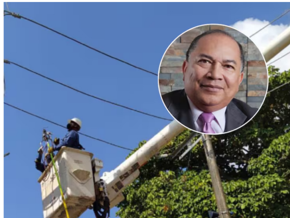
Imagen de referencia de energía eléctrica y el exministro de Minas y Energía, Amylkar Acosta.

El presidente Gustavo Petro habló en Estados Unidos sobre las sanciones contra empresas venezolanas