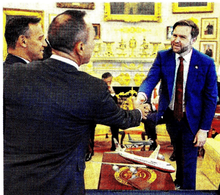
Pedro Sánchez, ministro de Defensa; Ricardo Roa, presidente de Ecopetrol; y, J.D. Vance, vicepresidente de Estados Unidos.