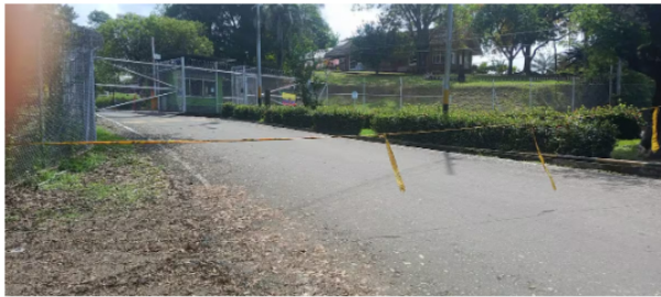
Habitantes del corregimiento El Centro mantienen protestas por presuntas afectaciones atribuidas a un pozo petrolero cercano a sus viviendas.