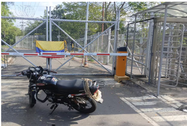
Habitantes del corregimiento El Centro mantienen protestas por presuntas afectaciones atribuidas a un pozo petrolero cercano a sus viviendas.

Siga las noticias de Vanguardia en Google Discover