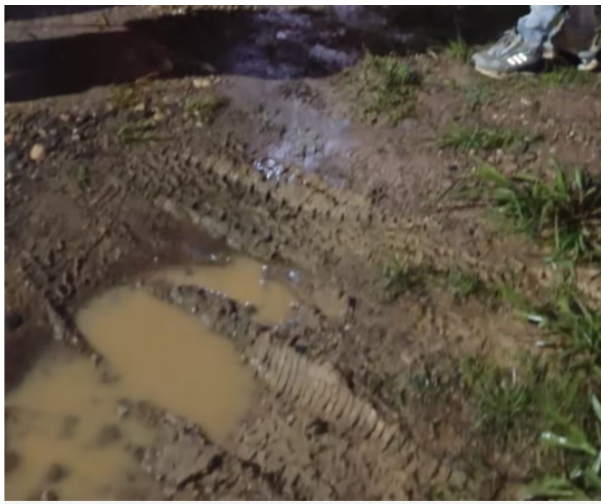
Habitantes del corregimiento El Centro mantienen protestas por presuntas afectaciones atribuidas a un pozo petrolero cercano a sus viviendas.

“A pesar de las reiteradas solicitudes, no se han adoptado medidas suficientes para garantizar nuestra seguridad, vulnerando nuestros derechos fundamentales. Para ellos poder entrar equipos tienen que comprar las casas y no quieren cumplir con la caída de la torre que dice que tiene que haber 100 metros a la redonda. Quieren venir a trabajar a las malas porque quieren abandonar el pozo, pero no quieren hacer la compra de las viviendas”, sostuvo el líder.