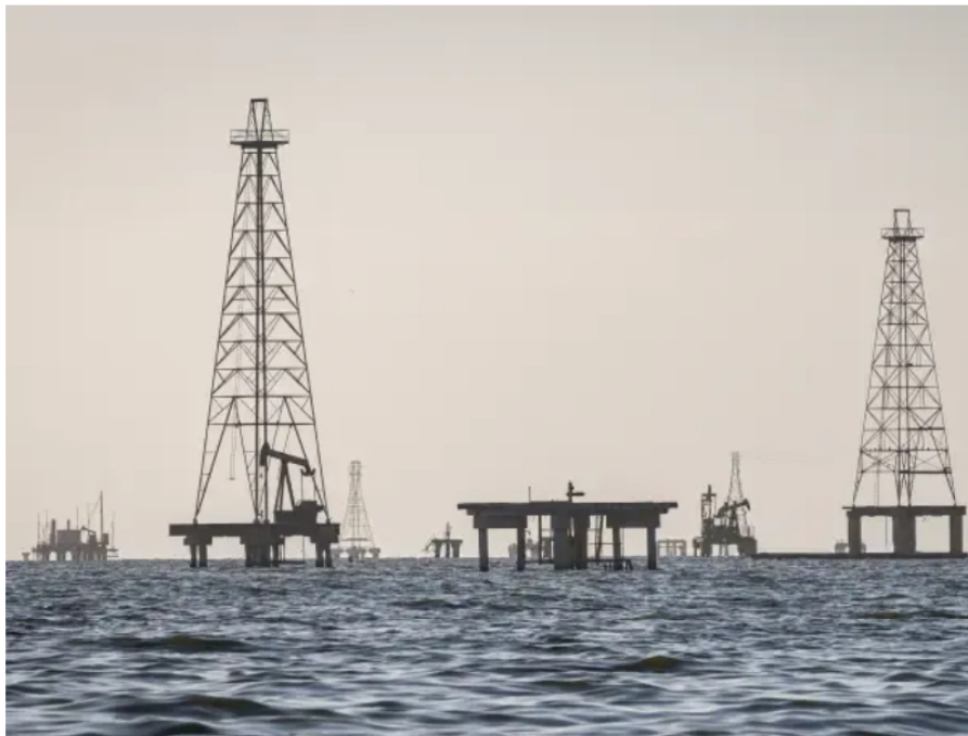
Plataformas petroleras en el lago de Maracaibo (Venezuela).

Sobre esto último, hay que tener en cuenta que la principal producción de crudo en el país vecino se centra en el occidente, específicamente en la región del Lago de Maracaibo, en el estado Zulia, frontera con los departamentos del Cesar, La Guajira y Norte de Santander .