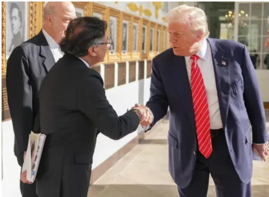
Presidente de Colombia, Gustavo Petro y de los Estados Unidos, Donald Trump.