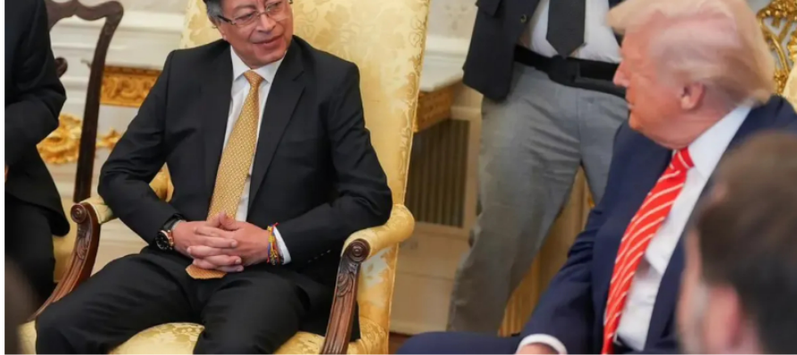
Encuentro entre Gustavo Petro y Donald Trump

Fitch alerta por un efecto dominó en el que rebaja de la calificación ya golpea a las empresas