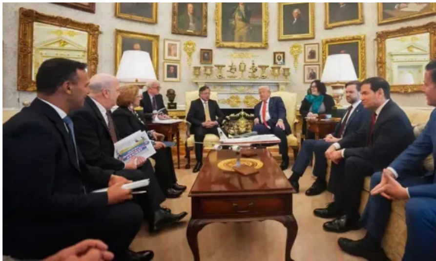
Encuentro entre Gustavo Petro y Donald Trump

Así mismo, Venezuela fue otro eje central del encuentro , tanto por su dimensión política como por sus implicaciones económicas y energéticas y allí se puso sobre la mesa la necesidad de avanzar en la reactivación económica del occidente venezolano con apoyo de Colombia y, eventualmente, de Estados Unidos, bajo la premisa de que el aislamiento y las sanciones han sido, en sus palabras, “lo más antieconómico e irracional” que se ha hecho en la región.