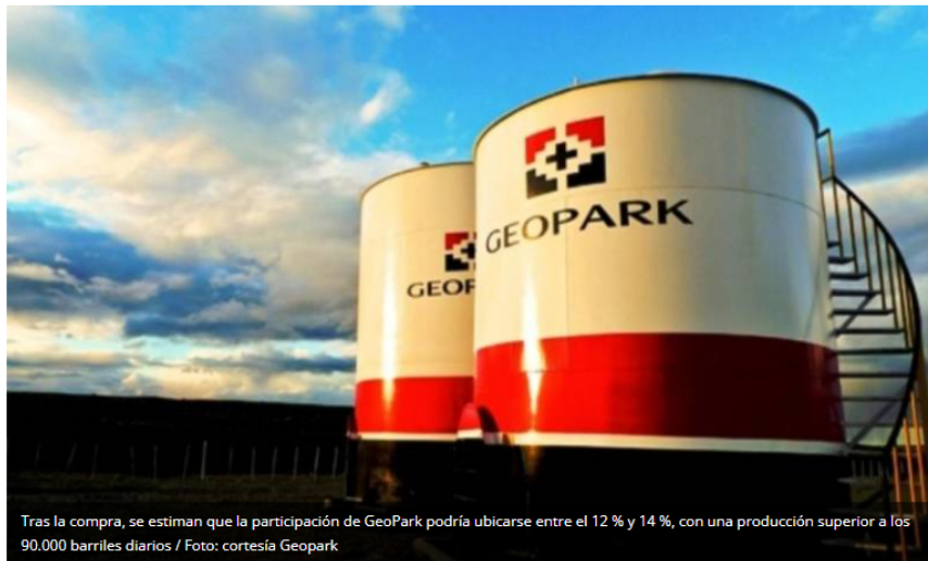
Tras la compra, se estiman que la participación de GeoPark podría ubicarse entre el 12 % y 14 %, con una producción superior a los 90.000 barriles diarios

Bogotá- La adquisición de los activos de exploración y producción de petróleo y gas de Frontera Energy por parte de GeoPark marca un reordenamiento relevante en el mercado de hidrocarburos en Colombia . Con esta operación, anunciada el 30 de enero de 2026, GeoPark se consolidaría como la principal empresa privada del sector, solo detrás de la estatal Ecopetrol .