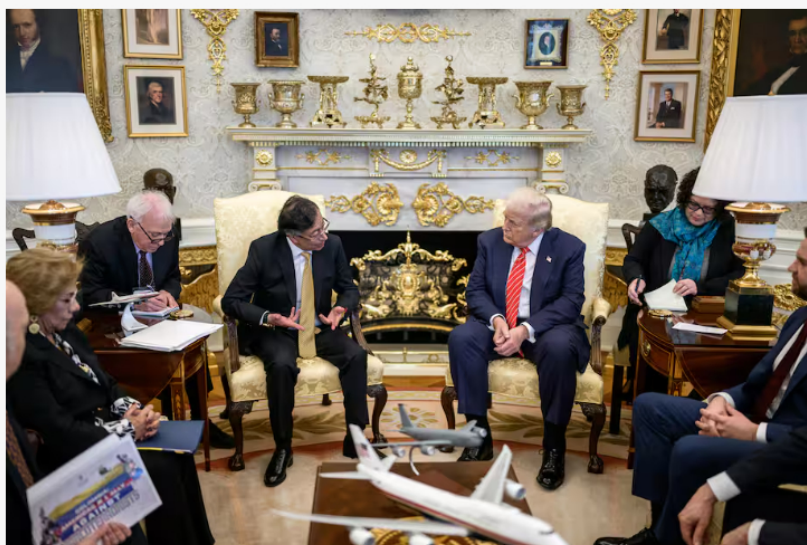
El presidente de Colombia, Gustavo Petro (c-i), junto a su homólogo de Estados Unidos, Donald Trump (c-d), durante una reunión este martes, en la Casa Blanca, en Washington (Estados Unidos).

Se lo dije a Noboa en la reunión en Panamá hace poco: que hablemos. ¿Cuál es el problema? Evitar a toda costa que la desinformación termine llenando de sangre la frontera, y la está llenando de sangre. Y nosotros no queremos eso, queremos paz. Ahí preguntó si teníamos las capacidades militares, etc., pero yo no quiero una guerra con Ecuador. Yo lo que quiero es que dialoguemos, que evitemos cualquier tipo de tensión; que nos permita que los muchachos de Ecuador, en su ejército, los muchachos nuestros, y muchachas, en nuestro ejército, puedan estar tranquilos; que se garantice la vida en la frontera; que el campesinado que se dedica hoy a cultivar hoja de coca extensamente en esa frontera, como ya comenzamos, como lo hice en Roberto Payán yo mismo, pueda comenzar por miles de trabajadores campesinos a erradicar realmente la vegetación de hoja de coca que hay en la frontera.