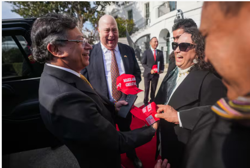
El presidente Gustavo Petro a la salida del encuentro con Donald Trump, su homólogo estadounidense.

puerto por la vida, como lo dijo a Trump, en las Américas, para mí, eso pone una “s” a la cachuchita roja que él me regaló, donde habla de una gran América, pero son las Américas, que deben ser grandes, todas... En esa medida creo que fue buena la reunión y que habrá más tensiones, pero aprenderemos a convivir en un mismo continente siendo diferentes.