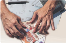
¿En qué casos los padres pueden quedar exonerados de la cuota alimentaria en Colombia?