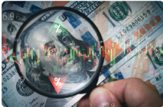
Dólar cerró más barato en Colombia: precio oficial de este 2 de febrero