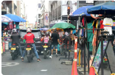
¿Por qué el gota a gota se volvió clave para la economía popular en Medellín?