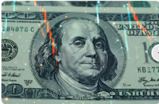
Precio del dólar en casas de cambio para este 2 de febrero: así se mueve la moneda