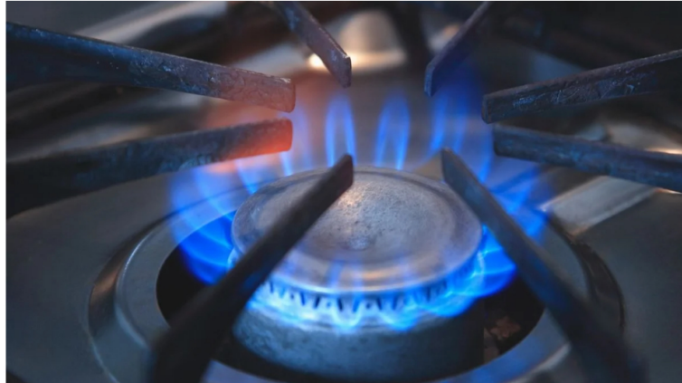
Gas natural

Ecopetrol y Frontera Energy firmaron un acuerdo estratégico para la contratación de servicios de regasificación que permitirá asegurar el suministro de gas natural importado a Colombia a partir del tercer trimestre de 2026, en medio del actual contexto del mercado energético.