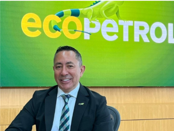
El presidente de Ecopetrol, Ricardo Roa.