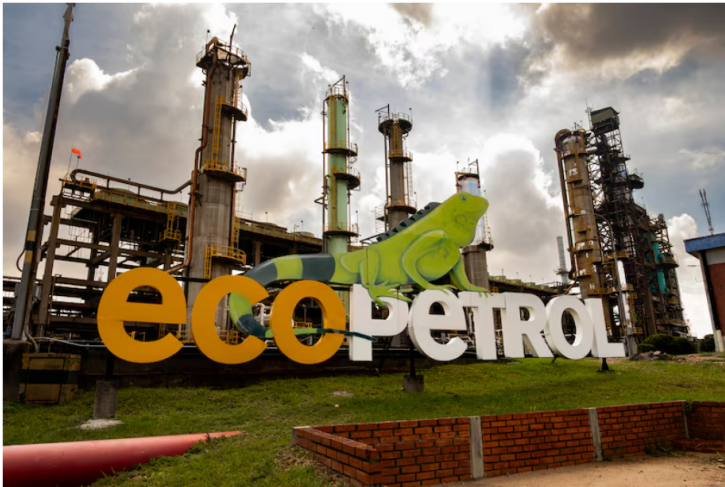
¿Cuánto vale Ecopetrol? Credicorp Capital actualizó su recomendación y precio esperado. Las acciones de Ecopetrol dependen en gran medida de la política energética del Gobierno Nacional y de los precios internacionales del petróleo Brent.

La firma aclara que sus proyecciones se dan en un contexto marcado por la normalización de los precios del Brent, una menor expectativa de dividendos para 2026 y un escenario político que sigue siendo determinante para el desempeño de la acción.