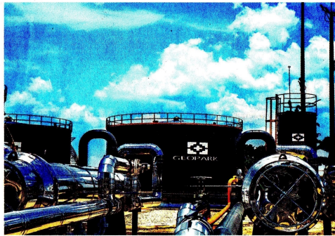
Frontera Energy venderá todos sus activos de exploración y producción de petróleo y gas natural que tiene en Colombia a la compañía GeoPark Limited.

más estratégicos son el campo Quifa (Meta), desarrollada en asociación con Ecopetrol (40 por ciento). También se destacan los bloques CPE-6 (Meta) y VIM-1 (Magdalena), este último compartido con Parex Resources (50 por ciento).