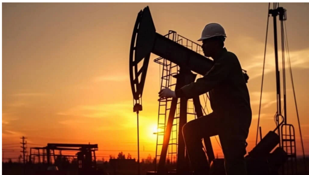
Sector petrolero.

Por: Manuel Alejandro Correa - 2026-01-30