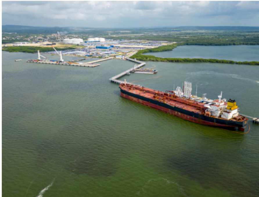
Puerto Bahía de Frontera Energy

Además de la producción de petróleo y gas natural, GeoPark sumará a sus cuentas de manera inmediata aproximadamente 99 millones de barriles de petróleo equivalente (mbpe) en reservas probadas (1P) y 147 mbpe en reservas probables (2P).