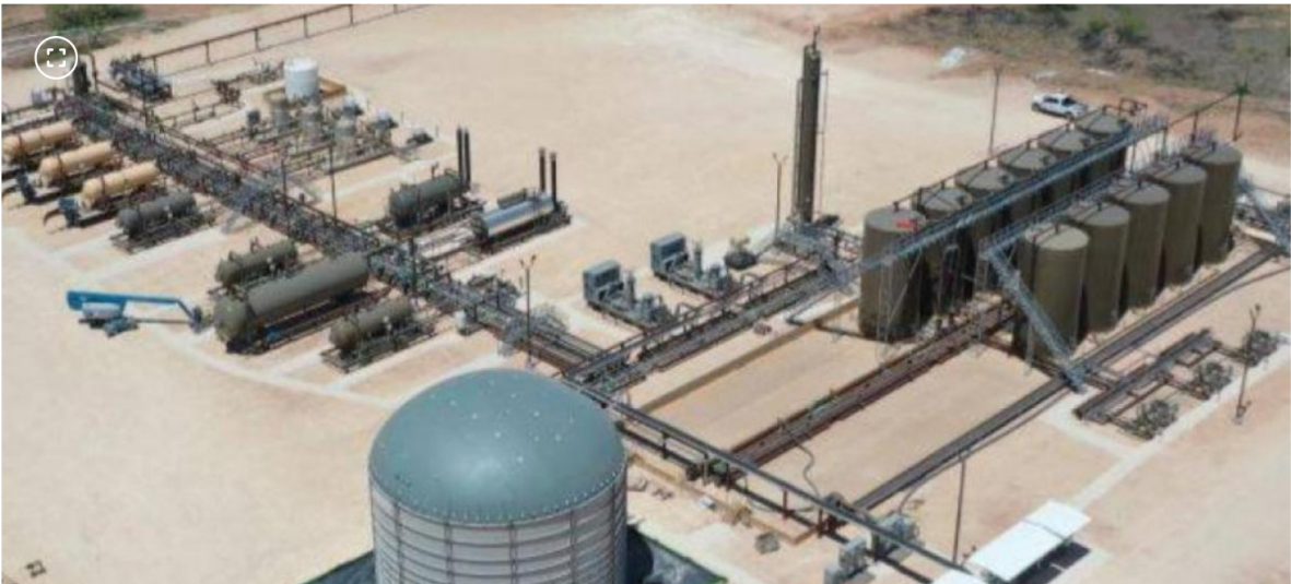
Producción de Ecopetrol en la cuenca Permian de Estados Unidos

El presidente de Ecopetrol, Ricardo Roa, anunció que se está estudiando la idea de salir de este activo.