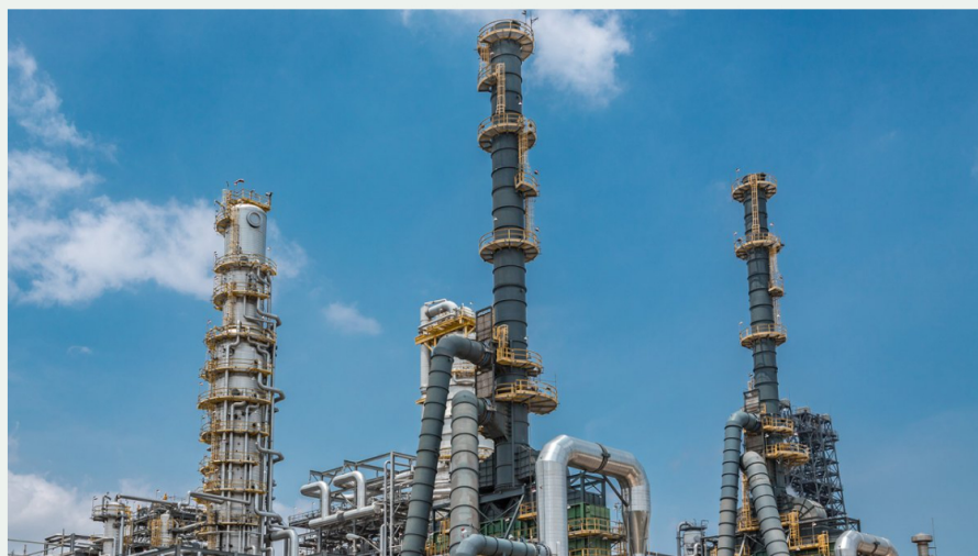
Refinería de Cartagena de Reficar (Ecopetrol).