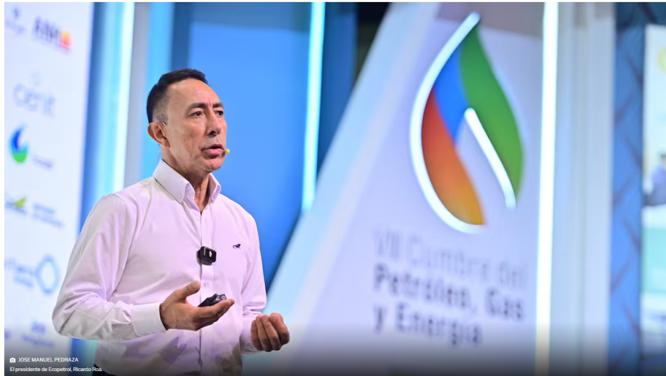
El presidente de Ecopetrol, Ricardo Roa