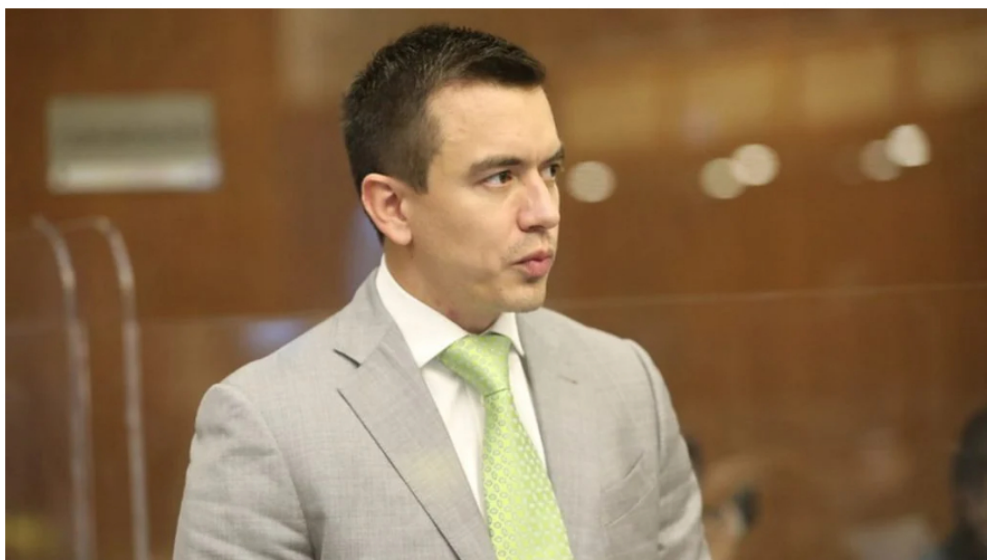
Daniel Noboa, presidente de Ecuador.