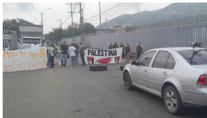
Vías cerradas en ambos sentidos en Yumbo por inconformidad con tarifas del transporte

"Estamos aquí con el grupo de mediadores de convivencia y se activó el Puesto de Mando Unificado (PMU) para garantizar el orden público dentro del municipio. Estamos siendo garantes con el Ministerio Público, Personería Municipal, de que vamos a respetar su derecho constitucional de manifestarse pública y pacíficamente, mientras no haya una alteración de orden público", señaló el funcionario.