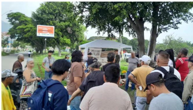
Manifestantes se reúnen para organizar una olla comunitaria, por ahora detuvieron el bloqueo, pero lo reanudarán en las horas pico.

El cierre de la vía se mantiene en ambos sentidos y se prevé que la jornada de bloqueos se extienda durante todo el día, donde manifestantes tienen planificado realizar en horas de la tarde una olla comunitaria y presentaciones artísticas.