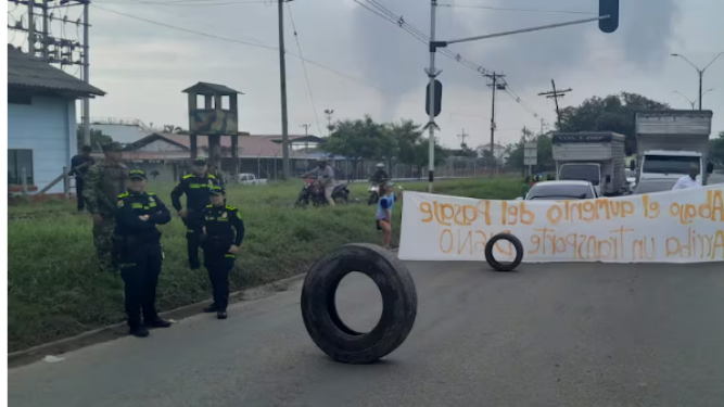
Vías cerradas en ambos sentidos en Yumbo por inconformidad con tarifas del transporte

Siga a EL PAÍS en Google Discover y no se pierda las últimas noticias