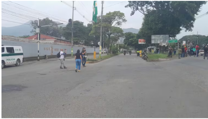
Protesta en Yumbo bloquea la vía a la altura de Ecopetrol por tarifas del transporte