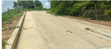
Culminó la construcción de 17 tramos de placa huella en la zona rural de San Vicente de Chucurí.

De acuerdo con la información entregada por Ecopetrol, las obras buscan mejorar la conectividad rural y facilitar el acceso de las comunidades a servicios, comercio y centros poblados. La compañía indicó que, además del impacto vial, durante la ejecución de los trabajos se promovió la vinculación de mano de obra local y la contratación de bienes y servicios en la zona, lo que permitió generar ingresos temporales y dinamizar la economía rural.