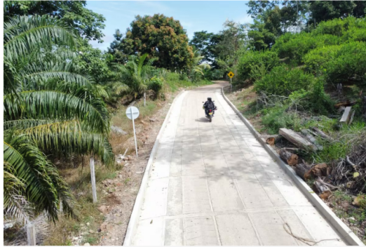
Culminó la construcción de 17 tramos de placa huella en la zona rural de San Vicente de Chucurí.

Siga las noticias de Vanguardia en Google Discover