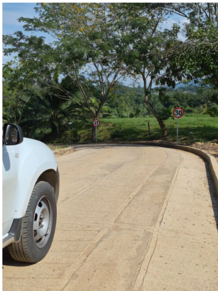
Culminó la construcción de 17 tramos de placa huella en la zona rural de San Vicente de Chucurí.

Por su parte, en el sector Los Camachos, los residentes coinciden en que la obra alivió una problemática de hace años. Javier Camacho, habitante de la zona, recordó que salir hacia otros puntos del municipio se había convertido en un verdadero "martirio", con trayectos que se extendían hasta 40 minutos debido al mal estado de la carretera.