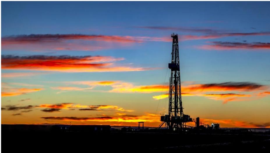
Producción petrolera.

Por: Manuel Alejandro Correa - 2026-01-27