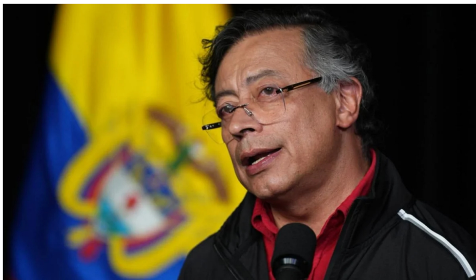
Presidente Gustavo Petro.