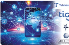
EPM confirma adjudicación del 100% de sus acciones en UNE. Con la operación, se crea un nuevo gigante de las comunicaciones