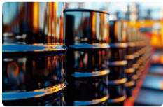
¿Qué lugar ocupa Colombia? El top de países de América Latina con el precio de la gasolina más caro