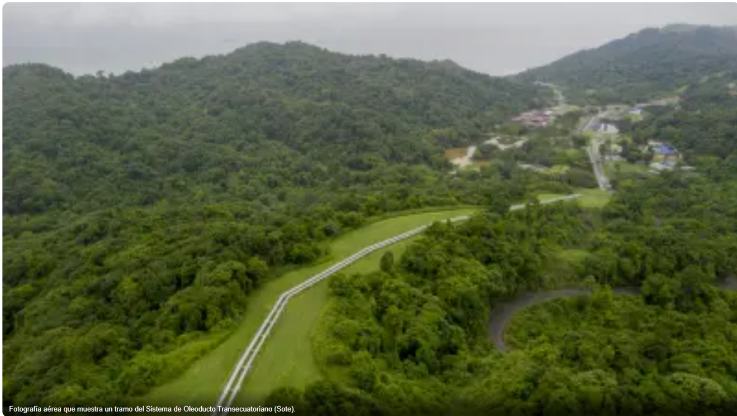
Fotografía aérea que muestra un tramo del Sistema de Oleoducto Transecuatoriano (Sote).

La ministra Inés Manzano indicó que Ecuador le está dando "un servicio importantísimo" a Ecopetrol al transportar el petróleo por el Sote, en medio de la guerra arancelario entre ambos países.