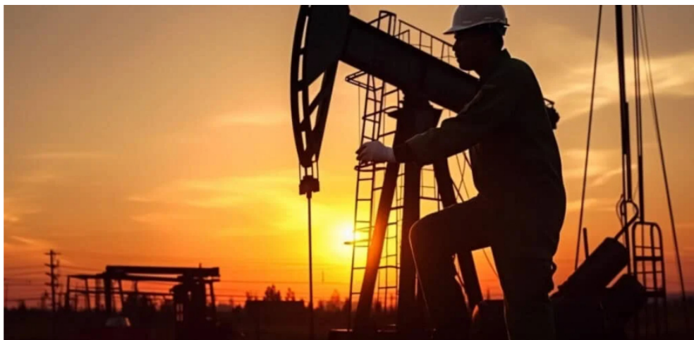
Sector petrolero.

Según medios internacionales, el Sote transportó casi 10.300 barriles por día (bd) de petróleo colombiano, de empresas privadas y Ecopetrol , en noviembre del 2025.