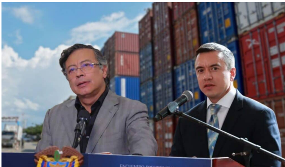
Colombia y Ecuador inician guerra arancelaria.

No obstante, la relación presentaba deterioros desde antes. A inicios de 2025, Ecuador deportó a colombianos sin haber llegado a ningún acuerdo con Colombia. Mientras que a finales del año pasado restringió el paso fronterizo, dejando solamente habilitado el Puente Internacional de Rumichaca como paso oficial.