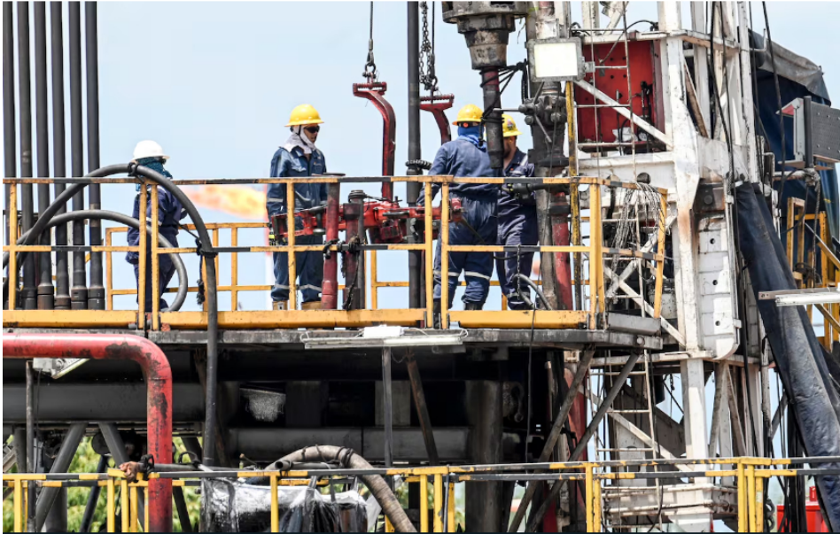
Los empleados trabajan con oleoductos durante la extracción de petróleo crudo en una planta de la petrolera colombiana Ecopetrol , en Acacias, departamento del Meta, al sur de Bogotá.