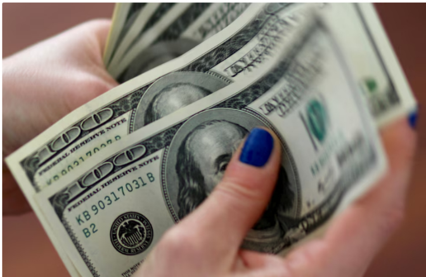
El transporte de un barril de crudo colombiano por el Sote de Ecuador costará 30 dólares

En conversación con el medio Radio Sucesos , indicó que la medida quedó establecida en una resolución expedida por la Agencia de Regulación y Control de Hidrocarburos (Arch). En ella, se determina que la tarifa por barril de petróleo pasa de 3 dólares a 30 dólares. Según explicó, la determinación que tomó el Gobierno ecuatoriano en la materia está sustentada en valoraciones técnicas y legales sobre la situación con Colombia.