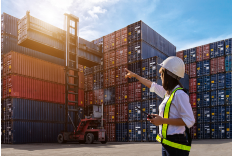
Colombia anuncia arancel del 30 % a más de 70 productos ecuatorianos.

El ajuste tarifario impacta directamente a la petrolera estatal colombiana Ecopetrol , que utiliza la red de tuberías ecuatorianas para sacar su producción hacia los mercados internacionales. Con esta decisión, el rubro por barril transportado experimenta un salto histórico.