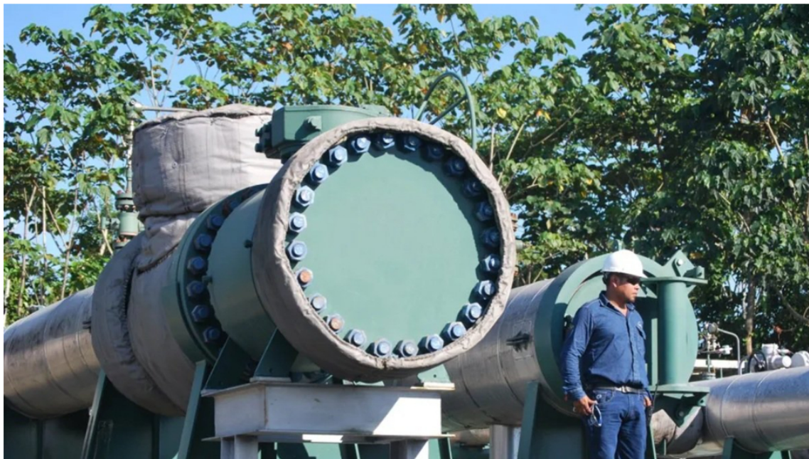
Un trabajador de la estatal Petroecuador en una foto de archivo.

Petroecuador incrementó drásticamente el costo de transporte para el petróleo de Colombia a través de sus oleoductos, pasando de 1,18 a 10,83 dólares