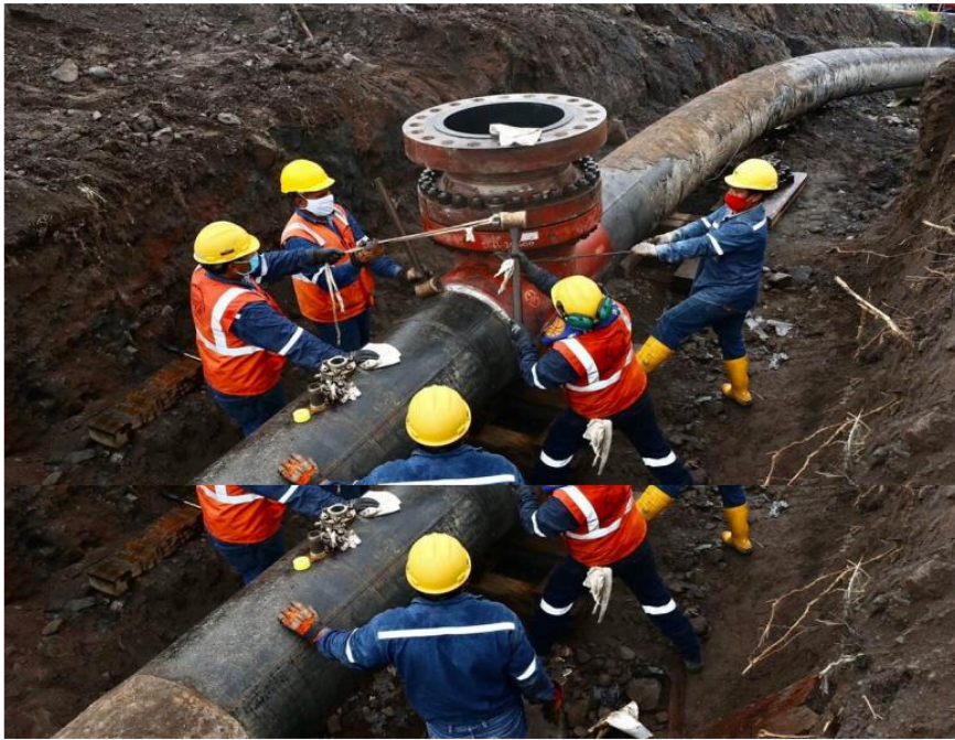
Ecopetrol transporta una parte del crudo, que produce en la zona sur, por el oleoducto ecuatoriano (foto referencial).